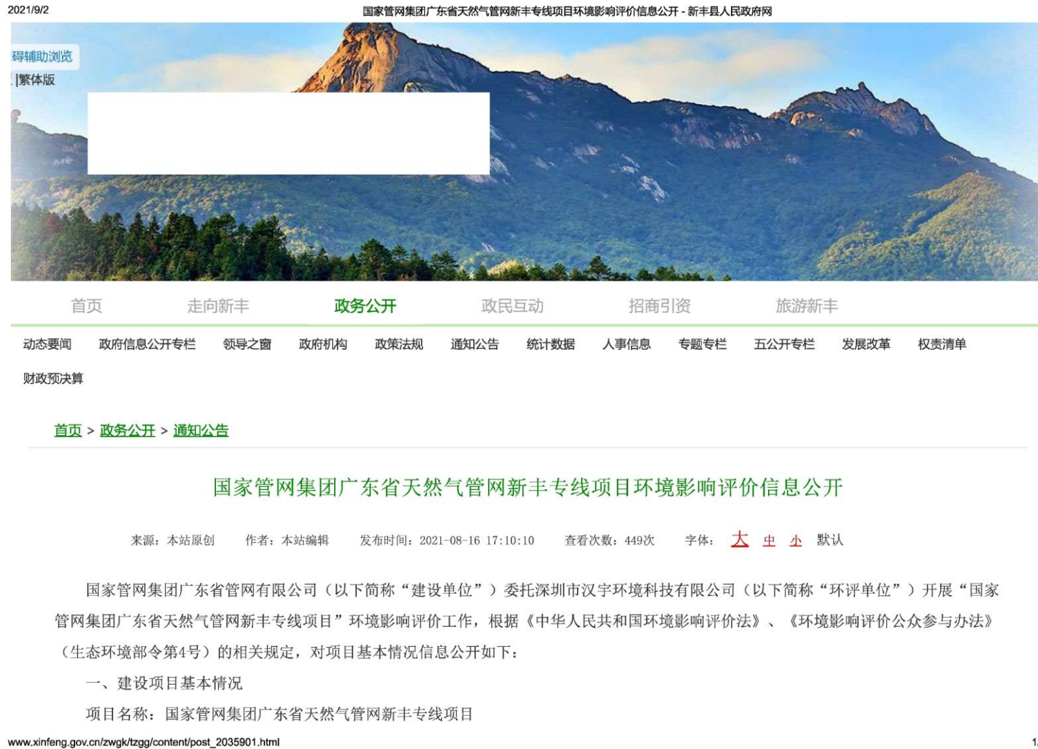
图 2-2 首次环境影响评价信息公开网上截图（1）