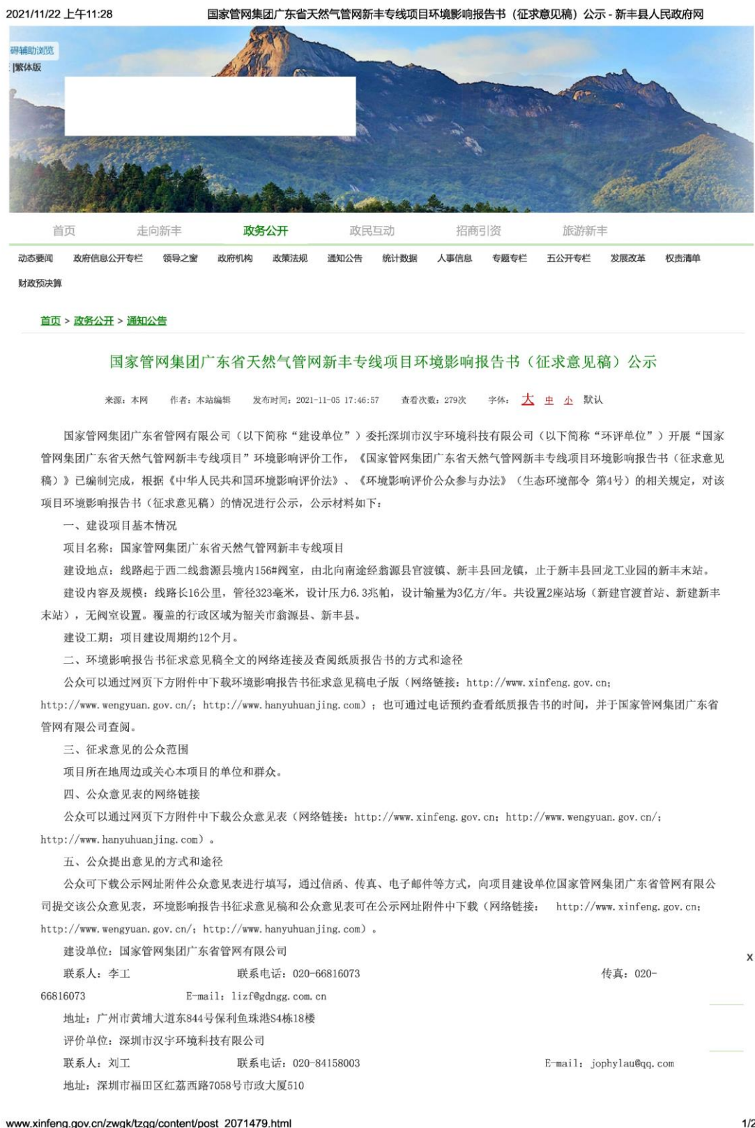
图 3-1 征求意见稿公示网上截图（1）