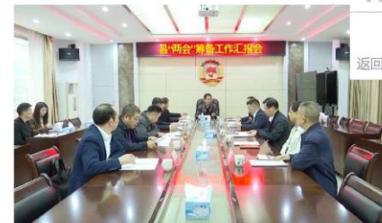
高忠率队到人大常委会、县政协机关调研指