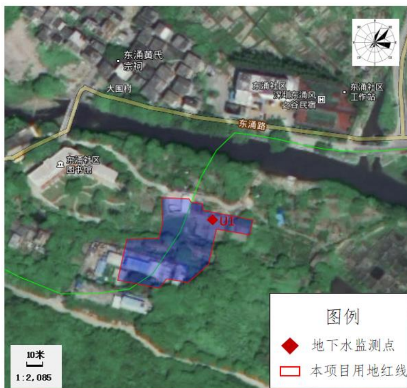
图 3-2 地下水监测点位图