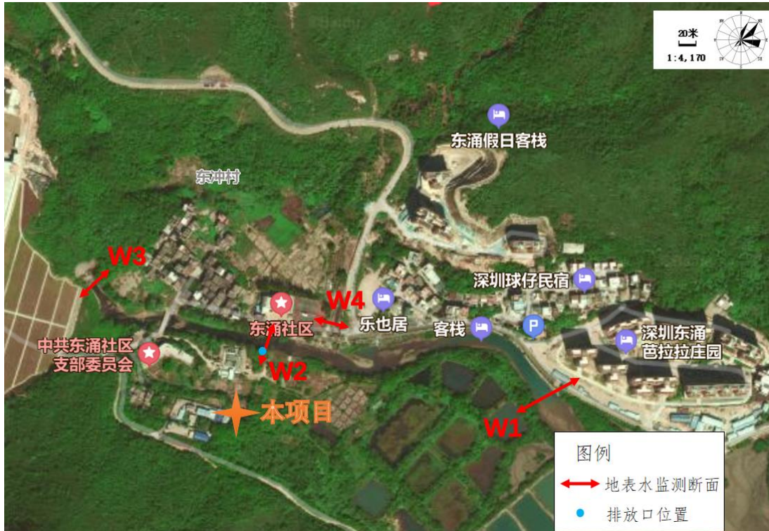
图 3-1 本项目地表水监测断面图

和排放口下游约 98 米东涌河左支汇入处 (W4) 进行补充监测, 见附件 1。监测点位见图 3-1, 监测结果及水环境质量评价结果如表 3-2~3-3 所示。从结果可以看出, 东涌河河水中 pH、溶解氧、COD Cr 、BOD 5 、NH 3 -N、TP、TN、粪大肠菌群均可达到地表水 V 类标准, 目前东涌河水质状况优良。