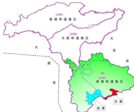
图 2-2 本项目服务范围（红色区域）

本次污水处理工程建设规模按旅游旺季的污水流量确定，设计近期建设规模 0.3 万 m^3/d ，远期总规模 0.5 万 m^3/d ，本次设计土建规模主要按照 0.3 万 m^3/d 进行，总变化系数 1.8，总占地面积 4013 m^2 。根据《东涌污水处理工程初步设计》，确定本项目服务范围包括大鹏新区南澳街道东涌社区，总用地面积 1293.13 公顷。