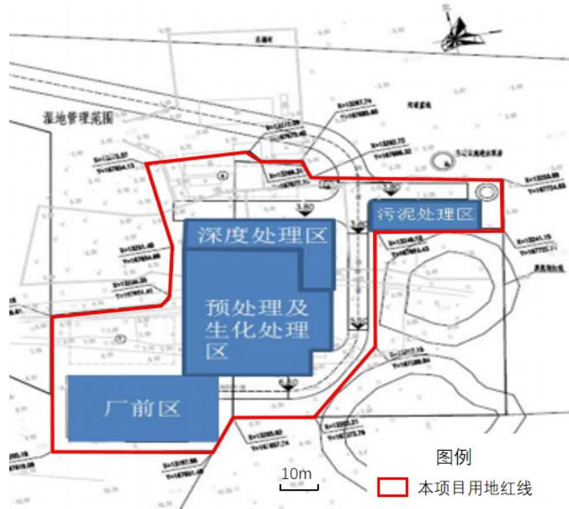
图 2-1 本项目功能分区示意图

北至南分别为平流式二沉池、生化池、生化池上方的鼓风机房、生化池上方及鼓风机房西侧的除臭车间、高压配电间、细格栅及旋流沉砂池。本工程生产区属于半地下建筑物。预处理及污水处理区西南方，亦即厂区西南部为厂前区，建有综合楼一栋，其中包括食堂、餐厅、办公区等功能。考虑到本项目用地紧张，为满足管理要求，不设置化验室。