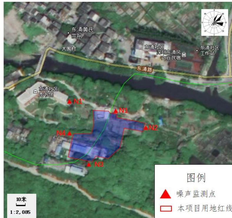
图 3-1 本项目噪声监测点位图

从监测结果可以看出，项目区域边界 1 米处昼夜噪声及敏感点中共东涌社区支部委员会噪声均能满足《声环境质量标准》（GB3096-2008）中 1 类标准要求。