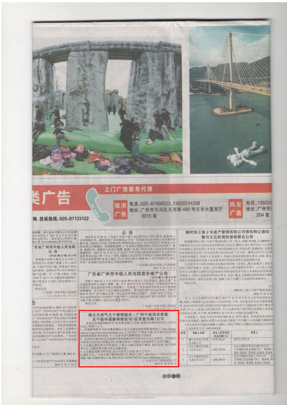
图 3-2 报纸公示 (2019 年 10 月 26 日)