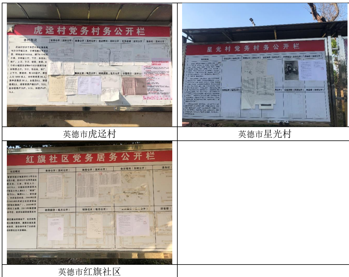
图 3-4 现场公示照片