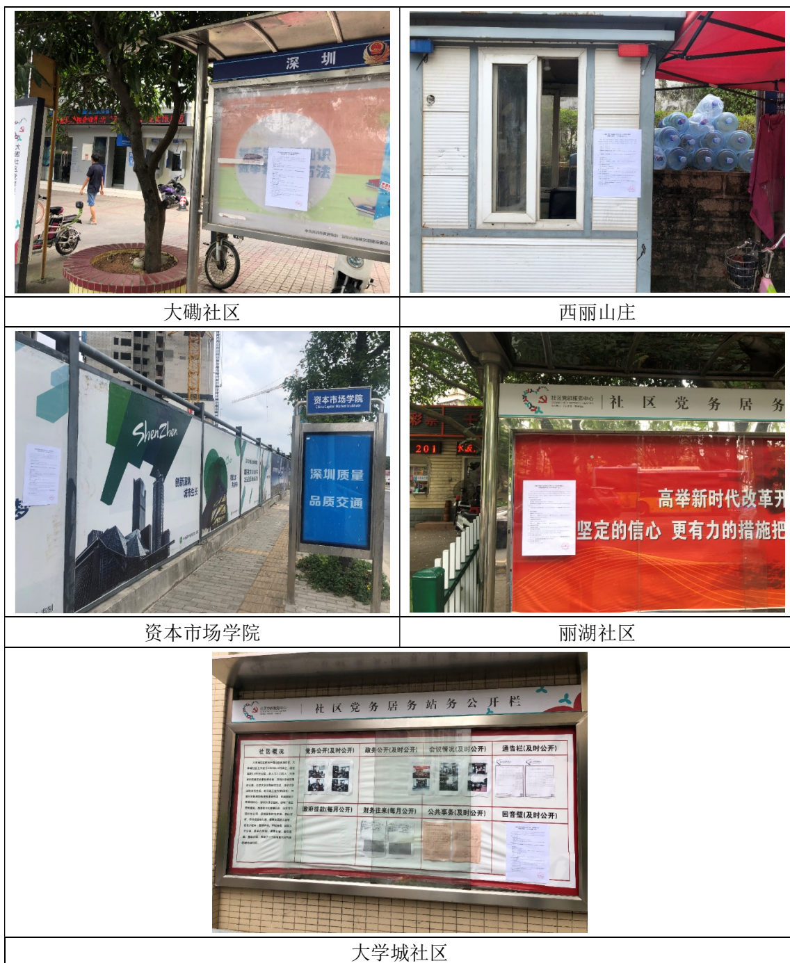
图 3.2-4 公众参与现场公告照片