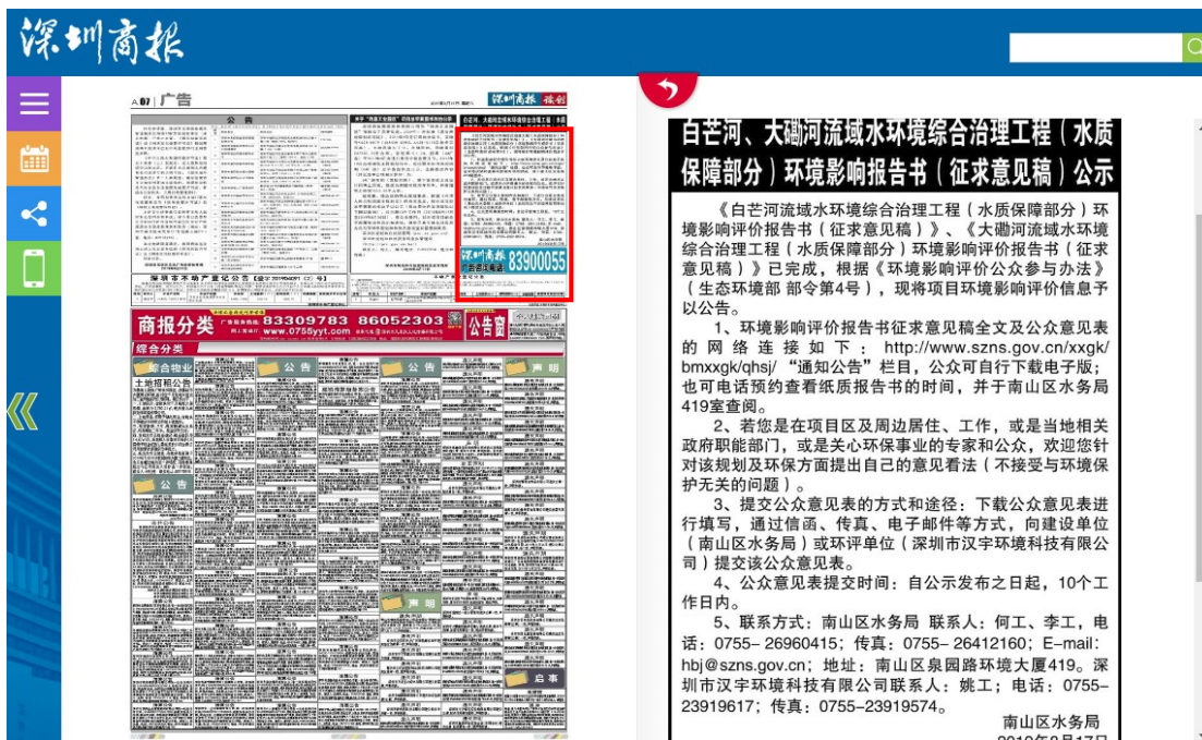
图 3.2-2 公众参与信息报纸公示截图

第一次报纸公示的位置在深圳商报 2019 年 8 月 17 日 A07 版，见下图。本次报纸平台公示的内容和方式满足《环境影响评价华公众参与办法》的要求。