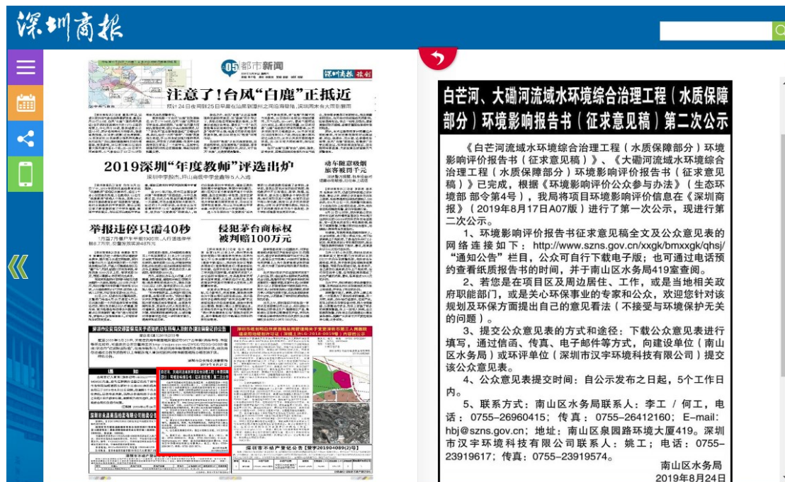
图 3.2-3 公众参与信息报纸公示截图

第二次报纸公示的位置在深圳商报 2019 年 8 月 24 日 A05 版，报刊扫描见下图。本次报纸平台公示的内容和方式满足《环境影响评价华公众参与办法》的要求。