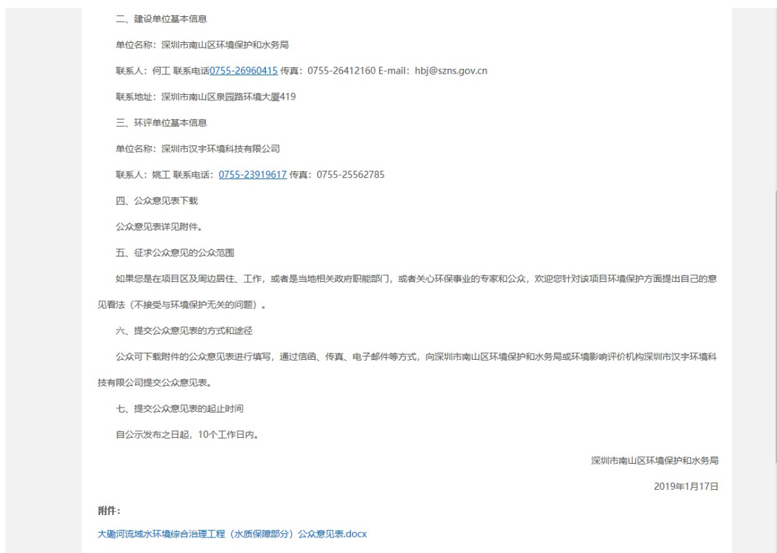
图 2.2-1 公众参与信息网络平台公示截图