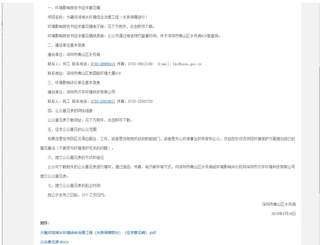
图 3.2-1 公众参与网络公示截图