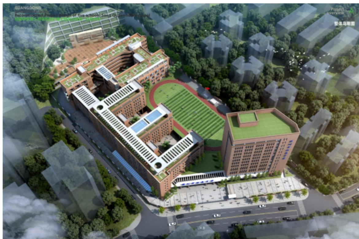
图 1-1 项目建筑效果俯瞰图