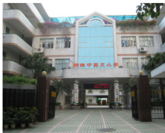
北侧明珠中英文小学