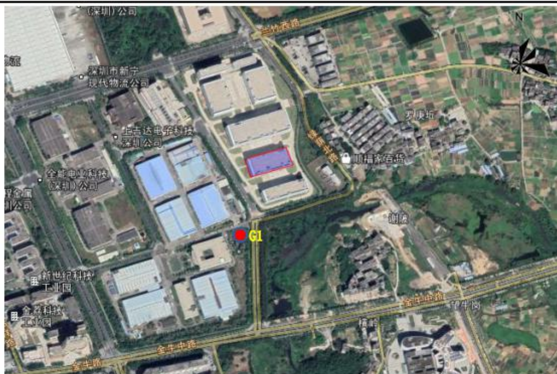
图3-1 大气监测点位示意图