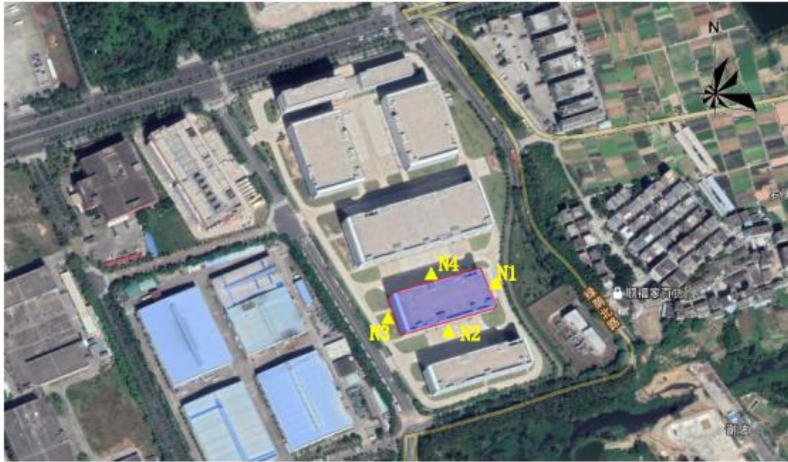
图3-2 噪声监测点位示意图

为了解项目所在区域的声环境质量现状，委托广东天鉴检测技术服务股份有限公司于 2019 年 1 月 16 日~1 月 17 日对项目所在四周设置 4 个监测点（N1-N4）。监测结果表明，本项目厂界昼间监测噪声值在 57.7~58.2dB(A)范围内，夜间监测噪声值在 46.3~48.3dB(A)范围内，满足《声环境质量标准》(GB3096-2008)中的 3 类标准要求。