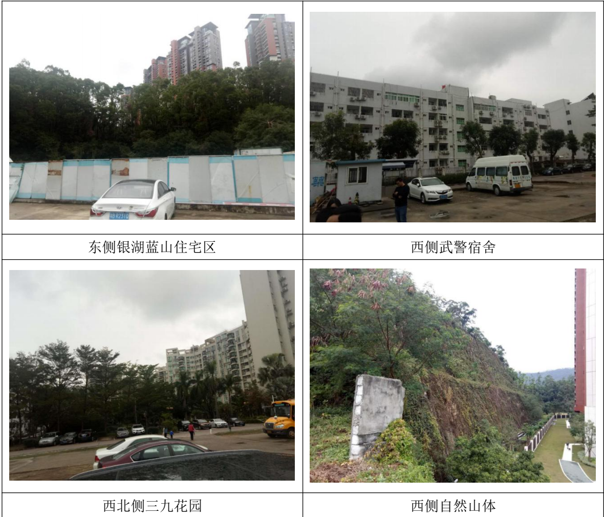
图1-2 项目四至实景图